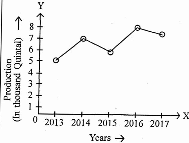
Production of wheat (In thousand quintal) in last five years

What is the ratio of production of wheat in year 2015 to year 2016 ?